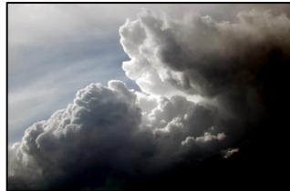
Nube de Tormenta Oscura

Predecir el clima es una ciencia llamada meteorología . Los meteorólogos usan indicios para predecir el clima y una de las formas en que lo hacen es observando nubes. Diferentes nubes significan diferentes cosas sobre el clima. Por ejemplo, si las nubes son oscuras y altas como montañas, podría significar que se avecina una tormenta. Si las nubes son blancas e hinchadas, probablemente signifique que el clima será agradable por un tiempo. Y si las nubes son largas y delgadas, probablemente estén en lo alto del cielo y esto nos dice que el clima va a cambiar pronto.