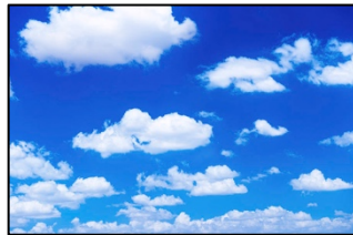
Nubes Blancas y Hinchadas