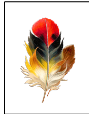
Pluma sin brillo: